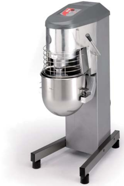
Mod.: BE 300 C