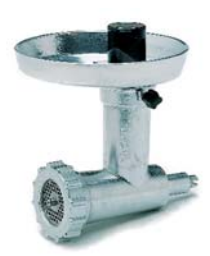
Picadora de carne Meat grinder