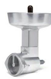
Prensa purés Potato masher