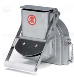
Cortadora-ralladora Slicing blade