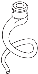
Gancho Amasador Spiral hook