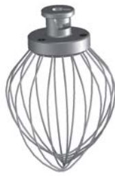
Revolvedora Balloon whisk