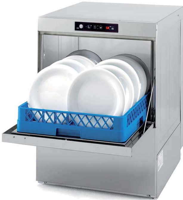
Mod.: LX 60